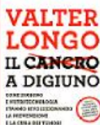
IL CANCRO A DIGIUNO

Longo nel libro fa un esempio per far comprendere la differenza di comportamento tra le cellule sane e quelle tumorali. Di fronte a un digiuno le cellule sane che hanno meccanismi di difesa normali si mettono in stand by barricandosi come dietro a uno «scudo», mentre quelle tumorali, che sono «sempre accese» continuano a crescere. Ma in questo modo la chemioterapia può agevolmente colpire le cellule