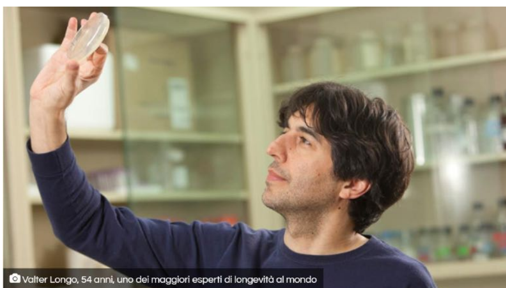
Valter Longo, 54 anni, uno dei maggiori esperti di longevità al mondo

Definito il massimo esperto mondiale di longevità, Valter Longo è convinto: nell'alimentazione è racchiuso l'elisir di lunga vita. Come dimostra nell'ultimo libro di prossima uscita.